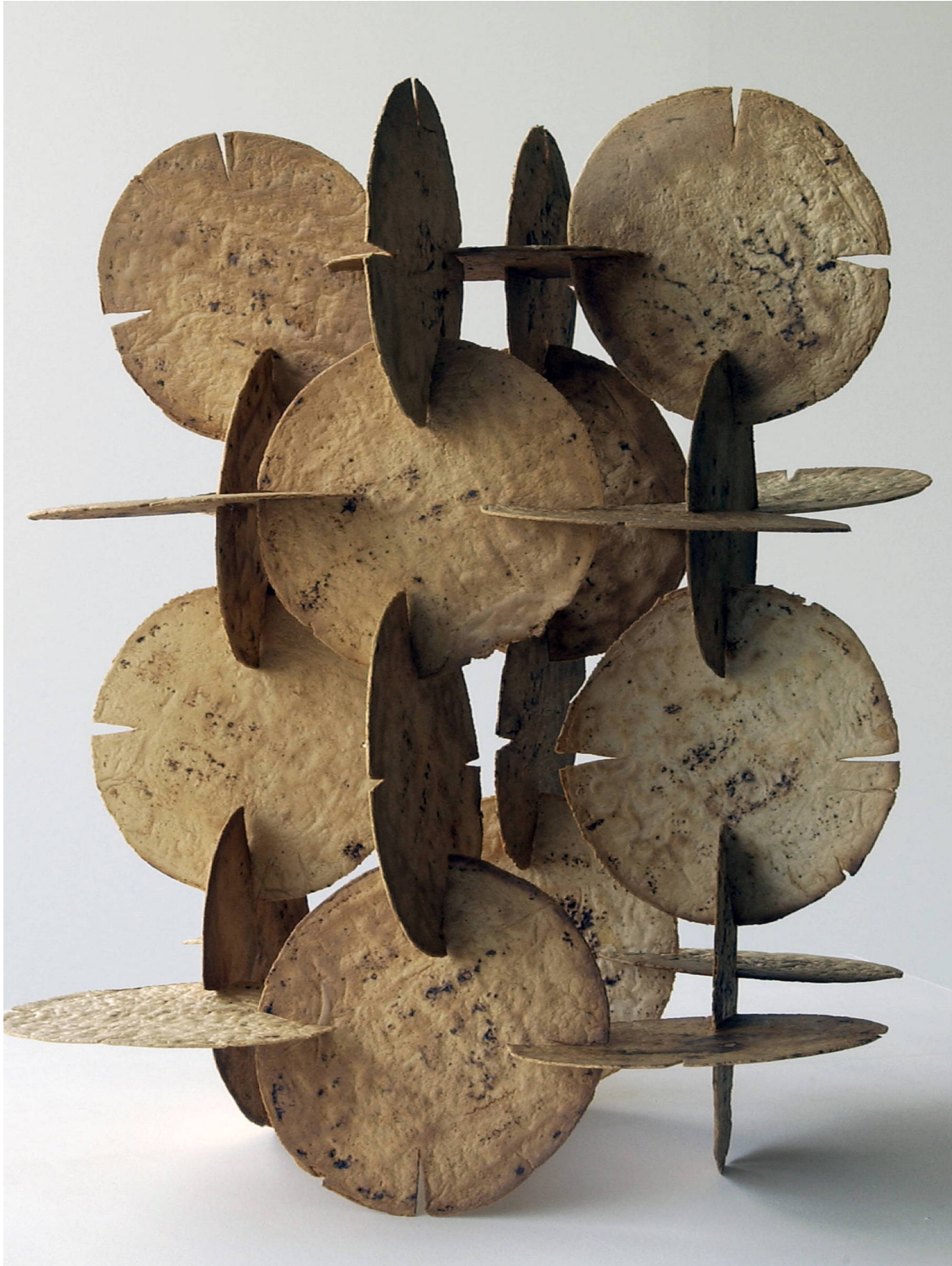
Obra do artista Damián Ortega, em cartaz no Masp

Folha de S. Paulo David Galantier Krasilchik Damián Ortega