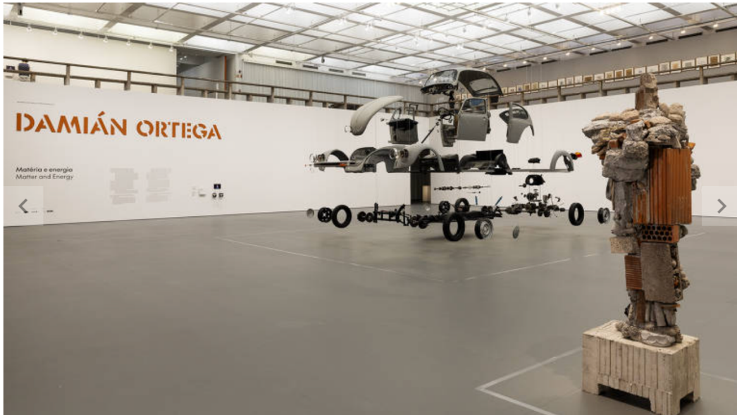
Vista da exposição 'Matéria e Energia', de Damián Ortega, no Masp