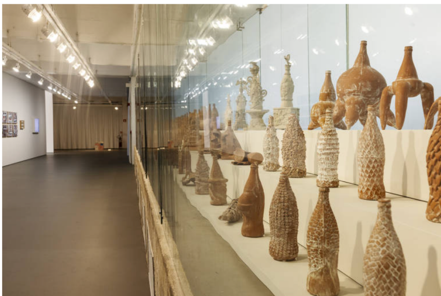
Esculturas da série '120 Dias de Trabalho', de Damián Ortega, em cartaz no Masp

Ainda sobra espaço para exercícios em vídeo, como os que complementam o fusca decomposto. No primeiro, cordas tiram da terra um fusca virado de cabeça para baixo. O tremular da lataria se assemelha ao de um inseto amedrontado, subordinado a testes científicos.