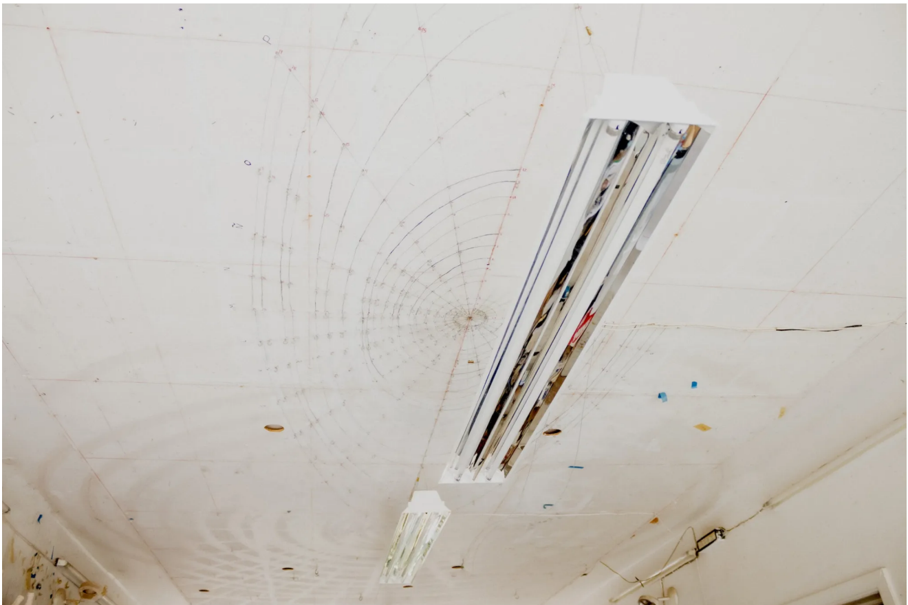
Diagramas en el techo del estudio de Damián Ortega.

La Tempestad María Oliveira Damián Ortega