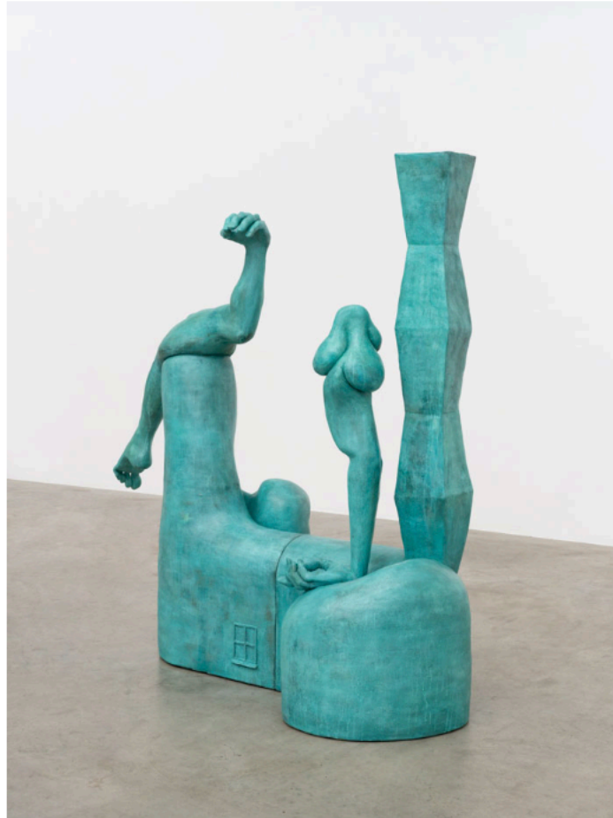
Jesse Wine, Positions , 2026. Cerâmica. © Eduardo Ortega. Cortesia do artista e Fortes D'Aloia & Gabriel, São Paulo/Rio de Janeiro