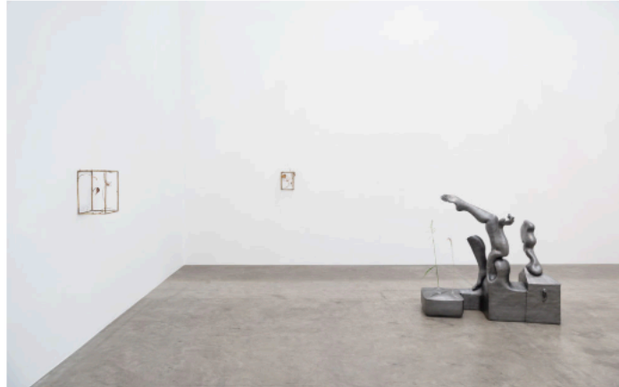
Vista da exposição, Jesse Wine Amor e outros estranhos .