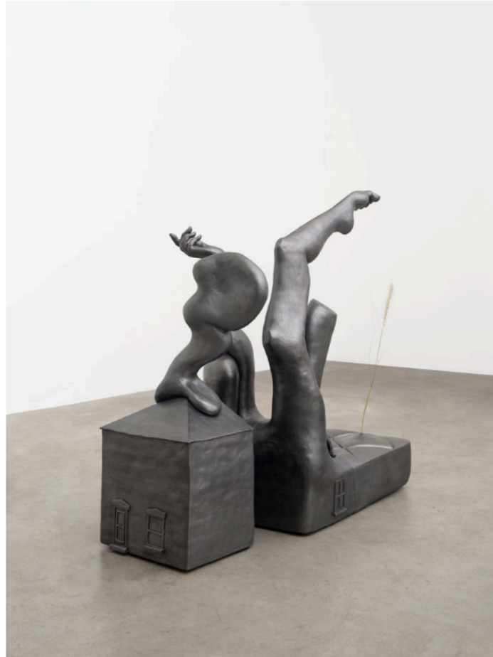
Jesse Wine, Evening, all day long , 2026. Cerâmica.