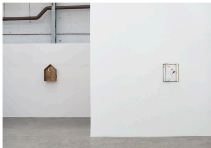
Vista da exposição, Jesse Wine Amor e outros estranhos . © Eduardo Ortega. Cortesia do artista e Fortes D'Aloia & Gabriel, São Paulo/Rio de Janeiro