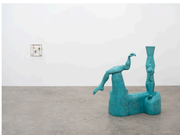
Vista da exposição, Jesse Wine Amor e outros estranhos .