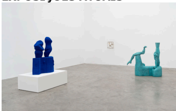
Vista da exposição, Jesse Wine Amor e outros estranhos .