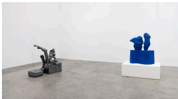
Vista da exposição, Jesse Wine Amor e outros estranhos . © Eduardo Ortega. Cortesia do artista e Fortes D'Aloia & Gabriel, São Paulo/Rio de Janeiro