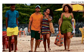
Salvador pelo Subúrbio é criada por Alan Miranda

OS CONFLITOS , questionamentos e memórias afetivas de uma família real que vivencia um passeio pelas praias e ilhas da região suburbana viram argumento para a série Salvador Pelo Avesto, de Férias no Subúrbio, que tem pré-estreia marcada para acontecer nesta quarta (28), às 19h, em parceria com o projeto Cine