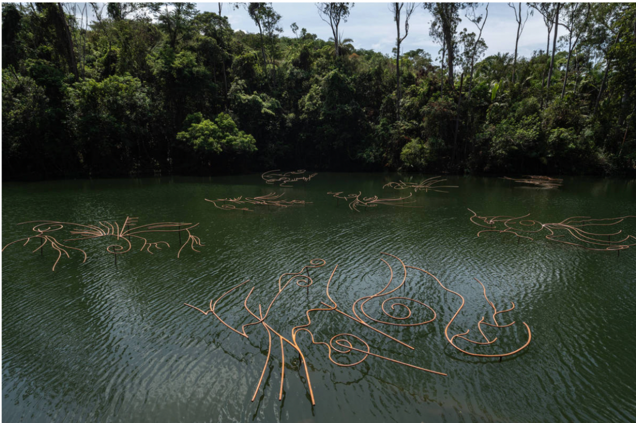
'Apenas Depois da Chuva', instalação escultórica de Rebeca Carapiá em lago do Inhotim

Com tempo, recursos e estrutura disponíveis, Carapiá produziu a sua maior escultura até agora, que soma mais de cem metros divididos em diversas peças instaladas no lago e na paisagem ao redor da galeria "True Rouge", de Tunga . Ela e seu irmão trabalharam por quase três meses junto a serralheiros do museu moldando ferro em formas abstratas curvas, que ficam dispostas sobre a água, como se flutuassem.