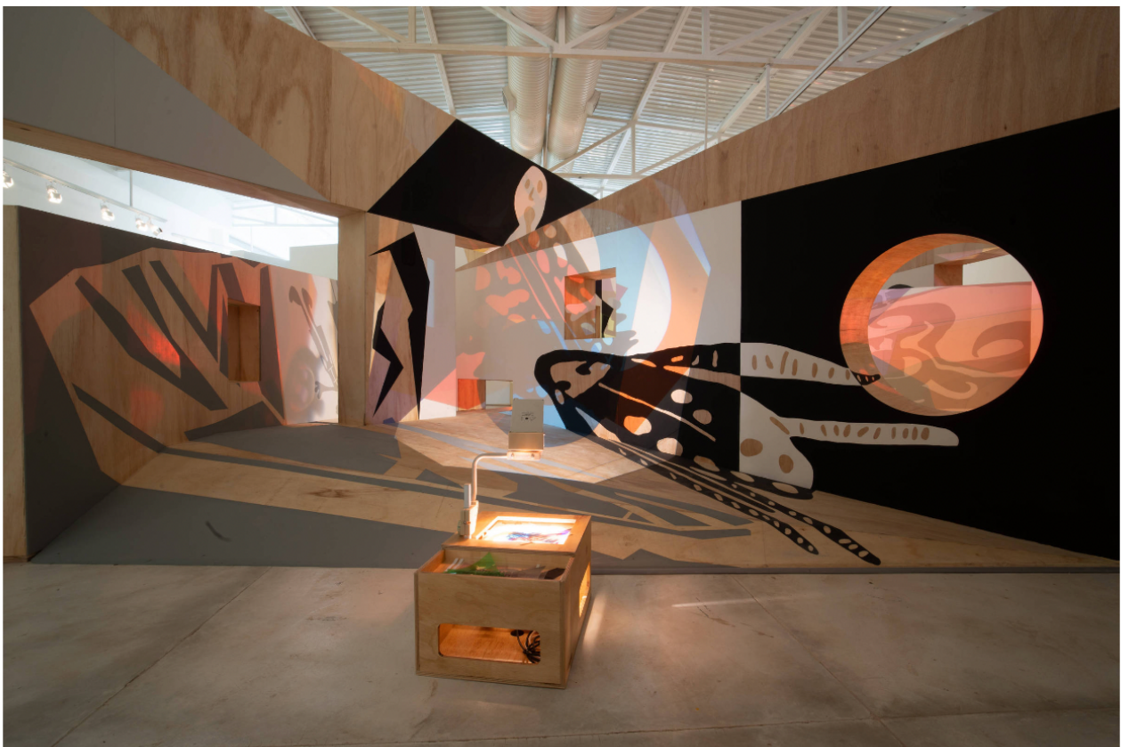
Vista de 'Alegoria do Medo', instalação de Rivane Neuenschwander no Inhotim

Neuenschwander então transformou as palavras e os desenhos das silhuetas das capas em lâminas de retroprojeter. O público que entra em contato com sua nova obra —inaugurada no último sábado no Inhotim— pode brincar com estas lâminas e projetá-las em paredes, partes de uma estrutura dentro da qual se caminha enquanto alto-falantes tocam sons associados ao medo, como portas rangendo.