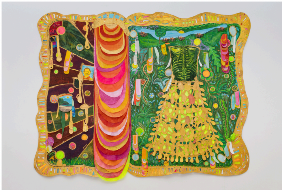
Leda Catunda, Caprichosa , 2024

Fortes D'Aloia & Gabriel apresenta Paisagem selvagem , a nova mostra de Leda Catunda na Carpintaria, que marca o retorno da artista ao Rio de Janeiro uma década após sua última exposição individual na cidade, no Museu de Arte Moderna. Os trabalhos apresentados mostram uma inflexão barroca na sua pesquisa, onde o acúmulo de elementos têxteis e citações imagéticas que caracteriza sua obra é intensificado por uma multiplicação de procedimentos e ornamentos e pela proliferação de formas de língua, saliências, barrigas estofadas e abas de tecido de todas as cores. Refletindo sobre o fluxo de estímulos visuais e digitais, Catunda se debruça sobre nossa exposição incessante aos ícones, signos e emblemas da cultura de massas.