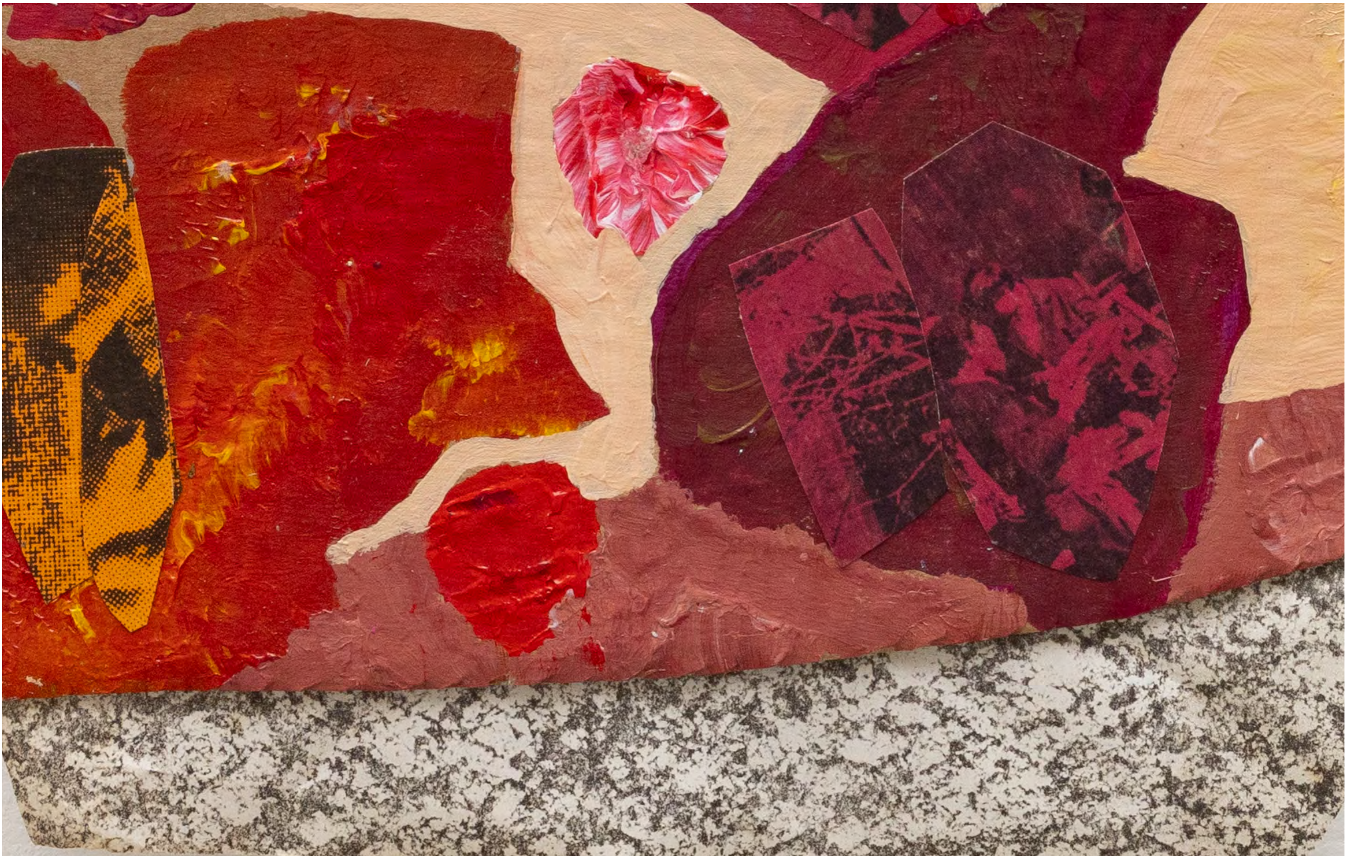
SARA RAMO Cadência celular, 2024 Detalhe [Detail]