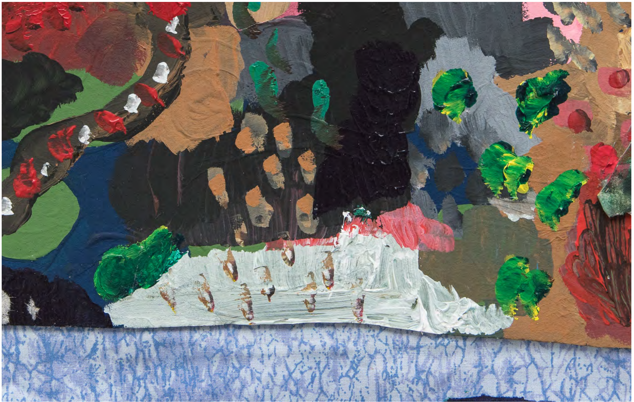
SARA RAMO Instinto amoroso, 2024 Detalhe [Detail]