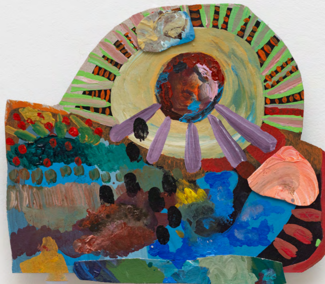
SARA RAMO Volúpia Astral, 2024 Acrílico e pastel oleoso sobre colagem [Acrylic, oil pastel and plastic bag on cardboard] 27.5 x 31.5 x 2 cm [10.8 x 12.4 x 0.7 in]