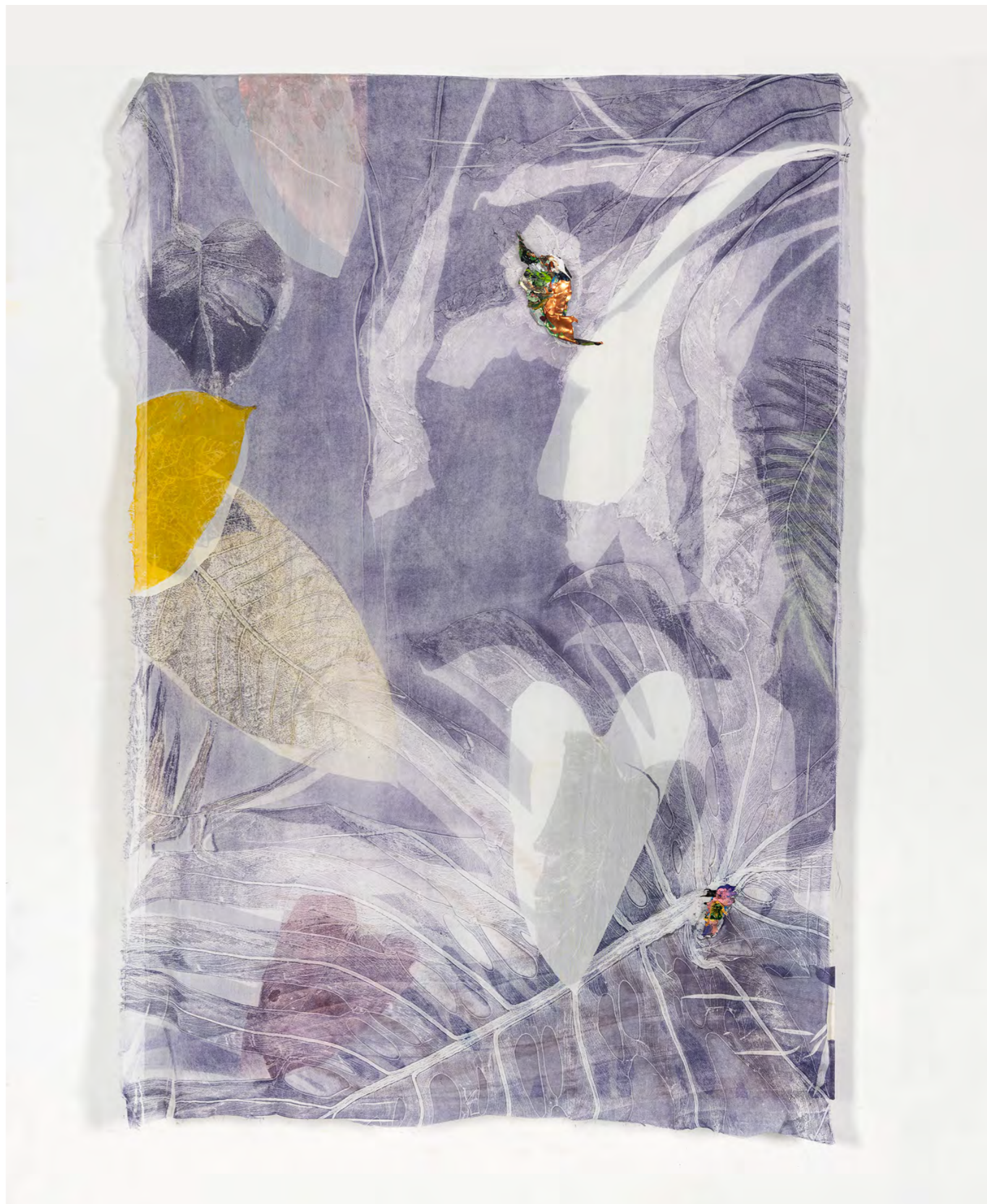
LUIZ ZERBINI Luz lilás, 2024 Acrílica sobre seda [Acrylic on silk] 96 x 65 x 3 cm [37.7 x 25.5 x 1.1 in]