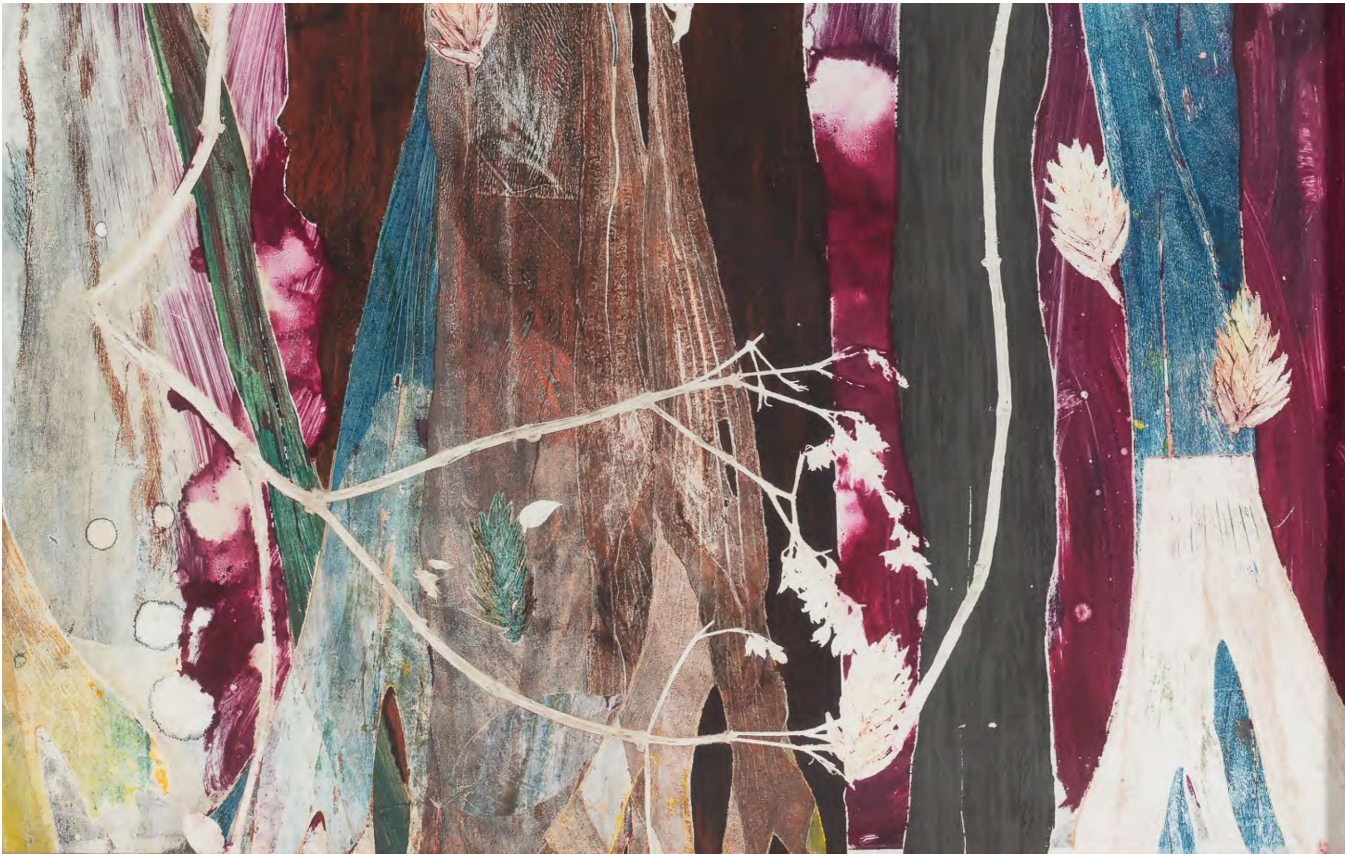
LUIZ ZERBINI Fogo fato, 2024 Detalhe [Detail]