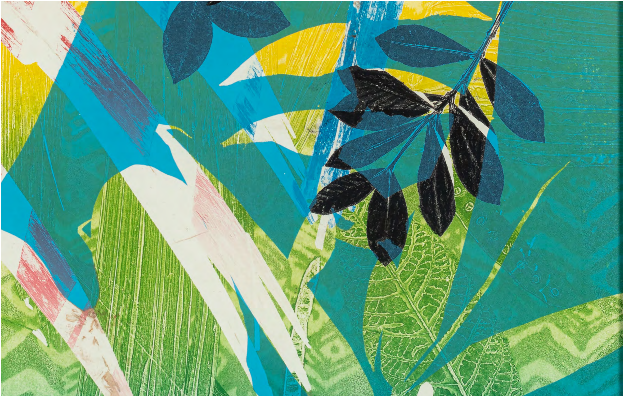
LUIZ ZERBINI Mata Atlântica, 2024 Detalhe [Detail]