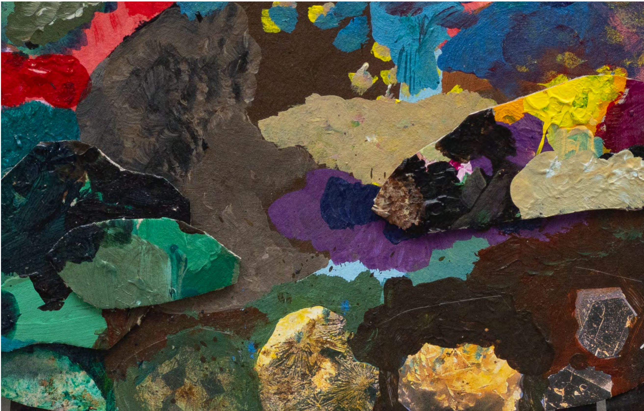
SARA RAMO Organismo espacial, 2024 Detalhe [Detail]