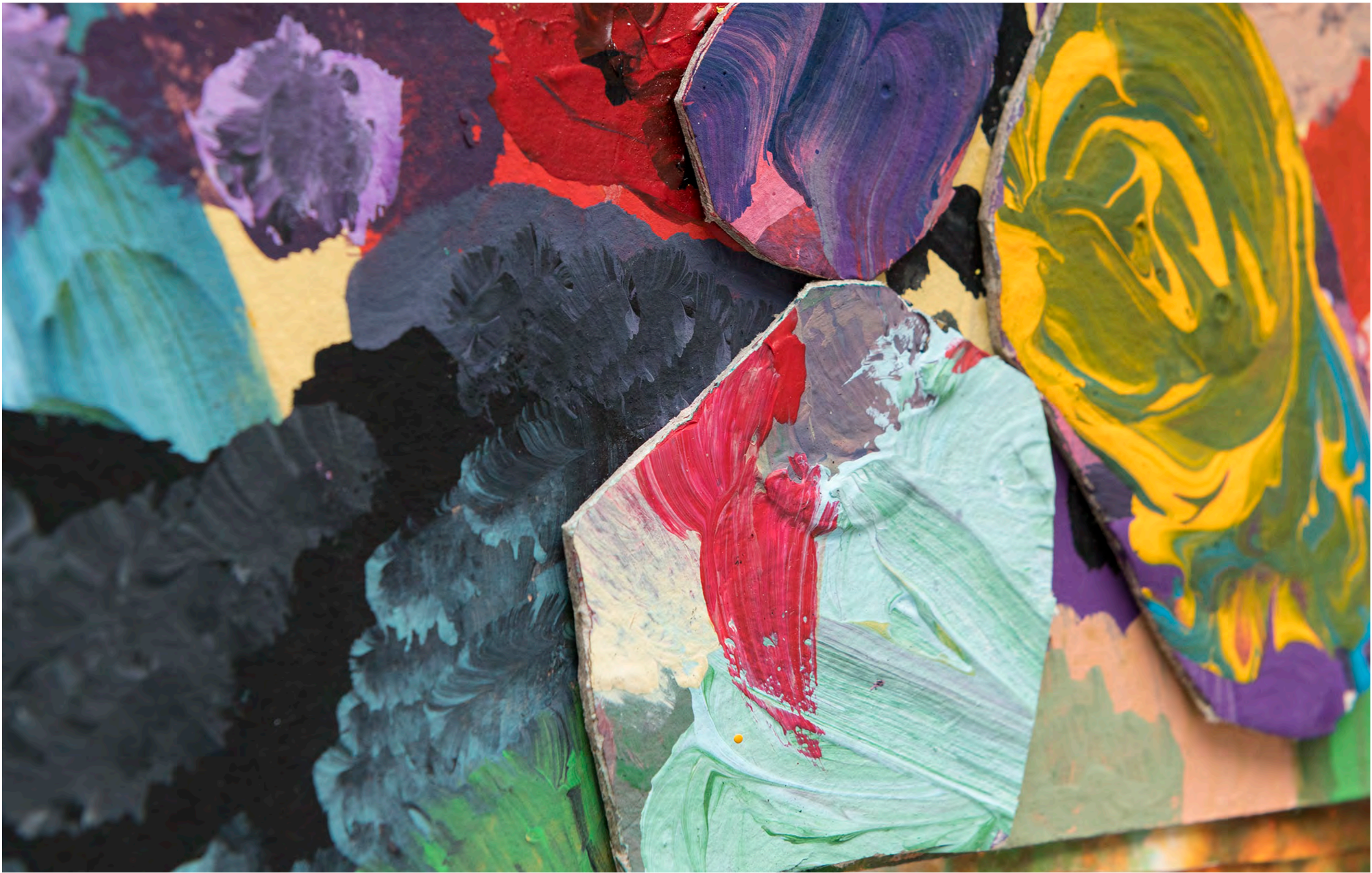
SARA RAMO Especulação cósmica, 2024 Detalhe [Detail]