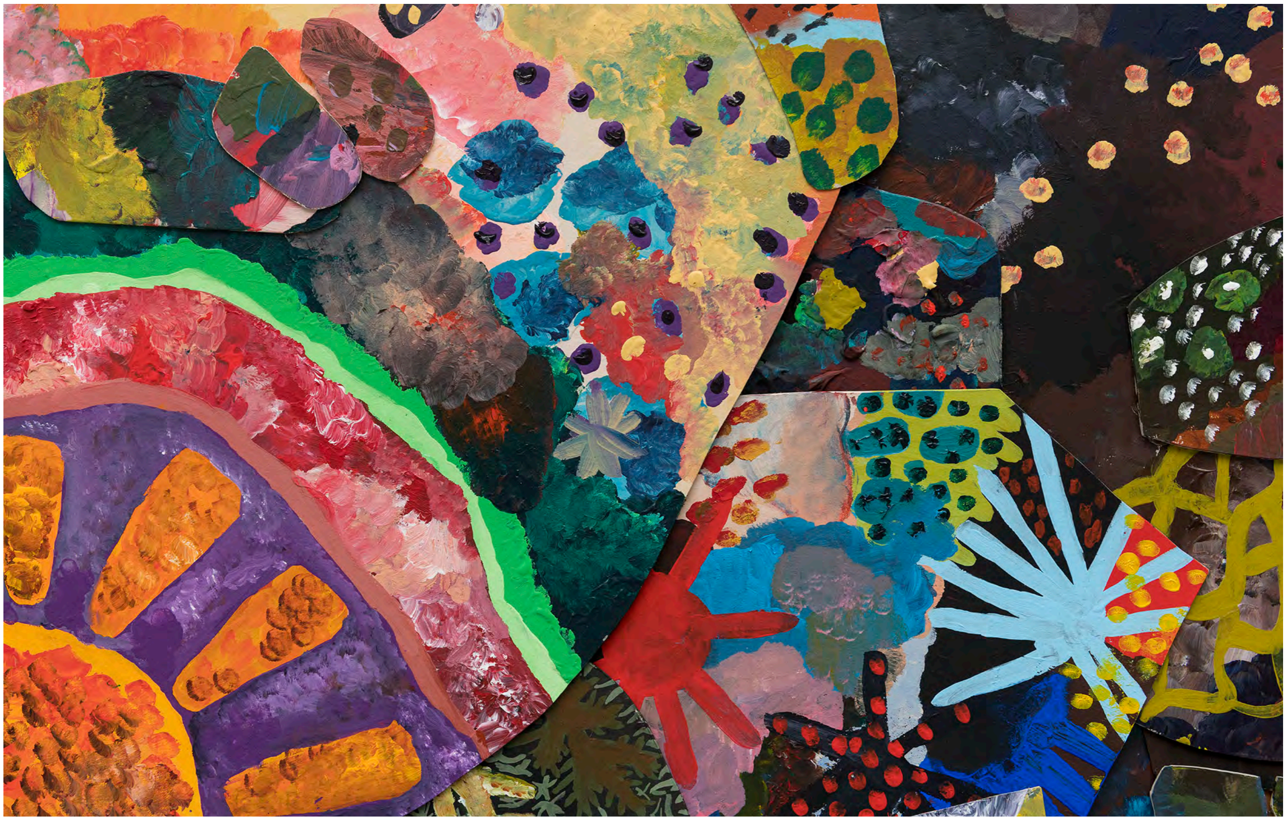
SARA RAMO Destino amoroso, 2024 Detalhe [Detail]