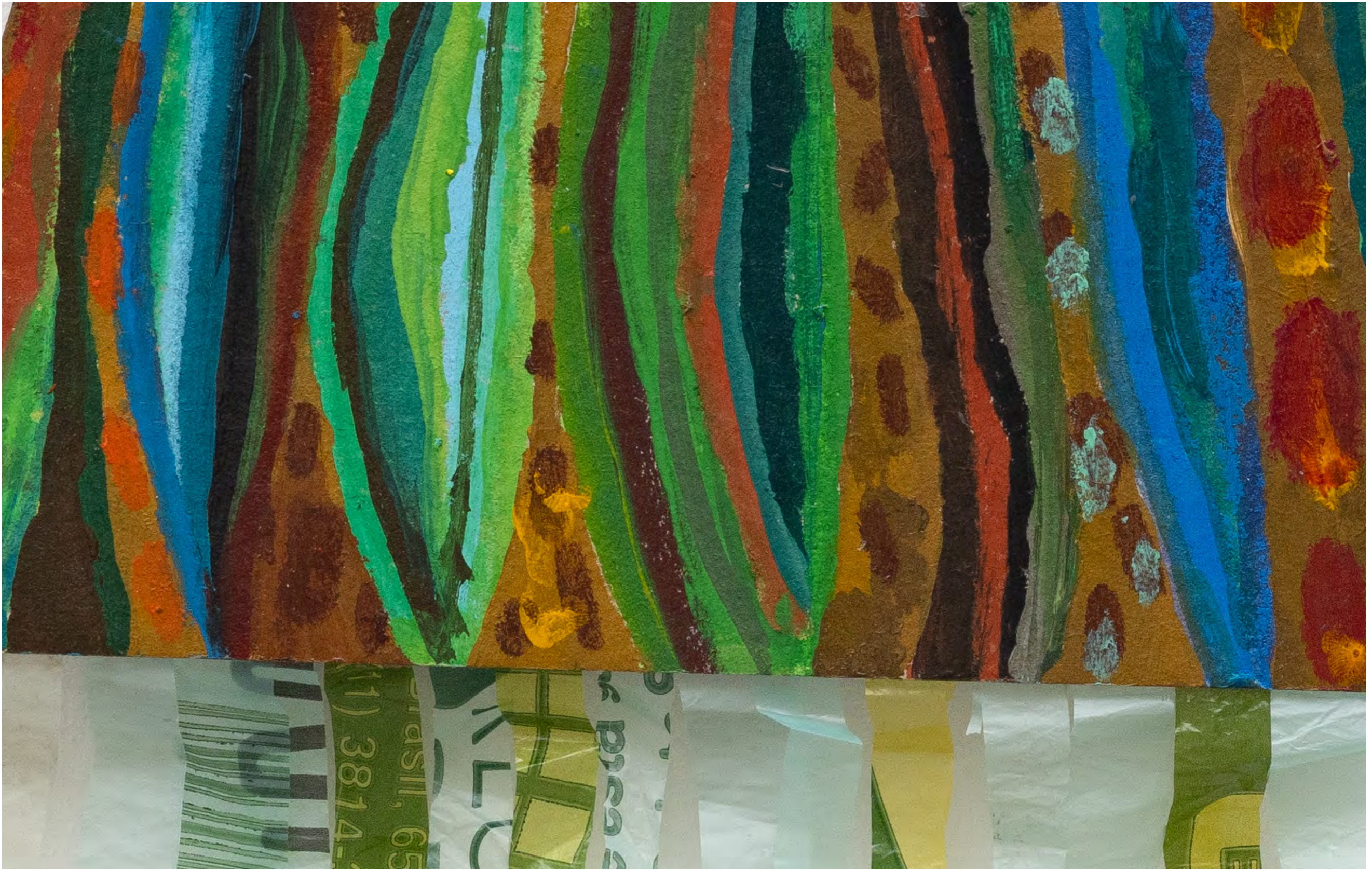
SARA RAMO Breve Sinal, 2024 Detalhe [Detail]