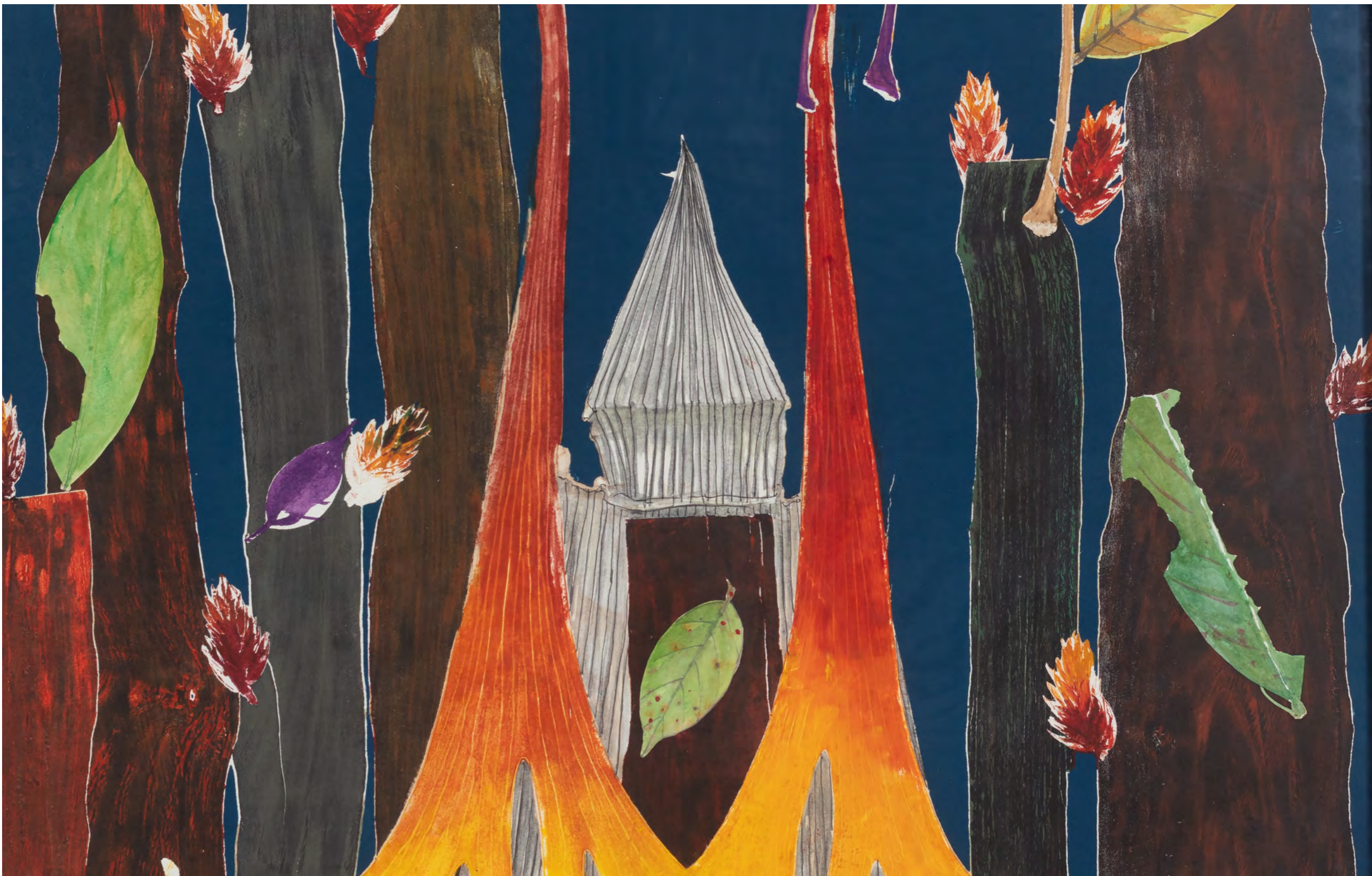
LUIZ ZERBINI Benin, 2024 Detalhe [Detail]