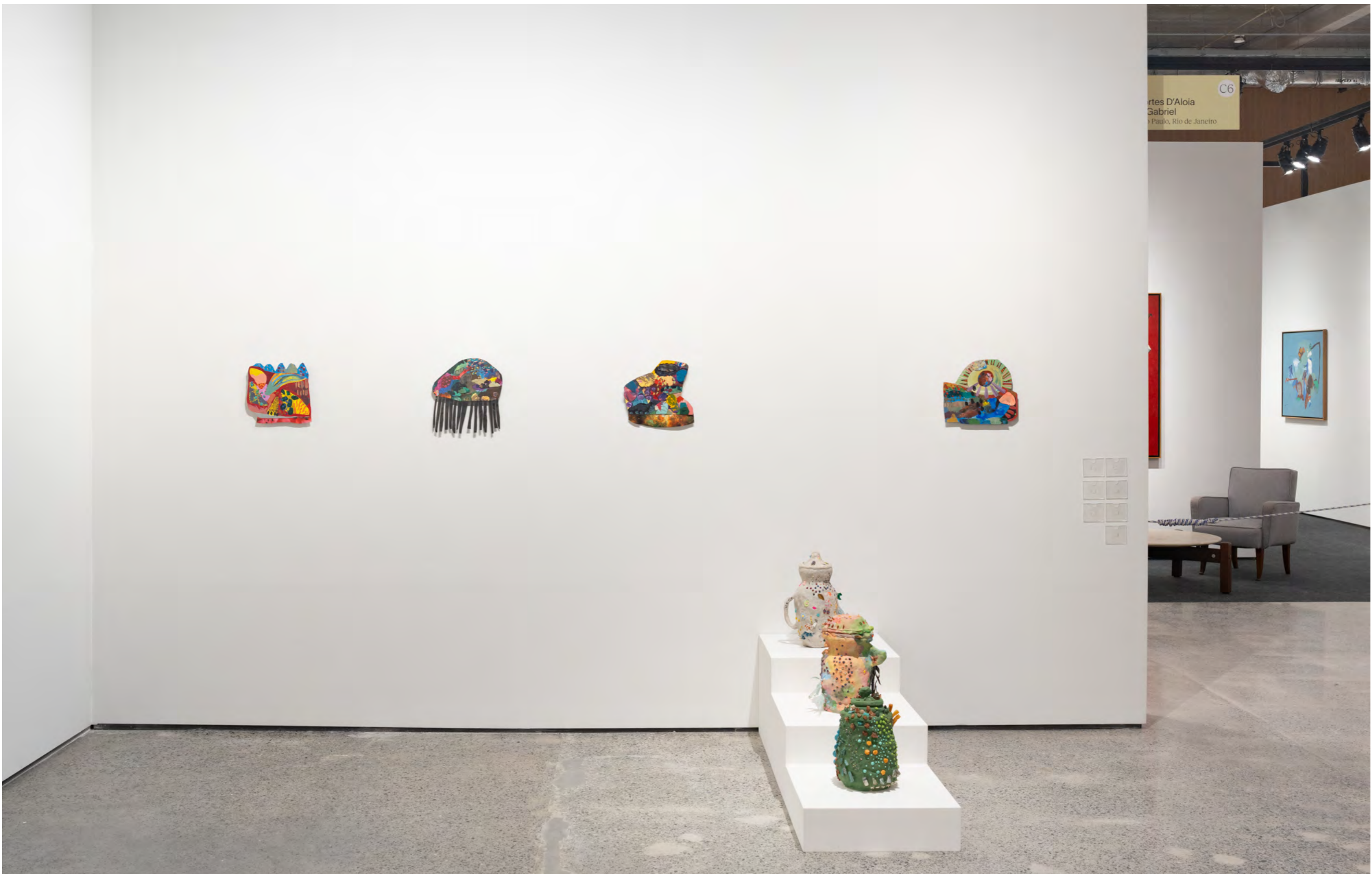
ArPa 2024 Complexo do Pacaembu | São Paulo, Brasil