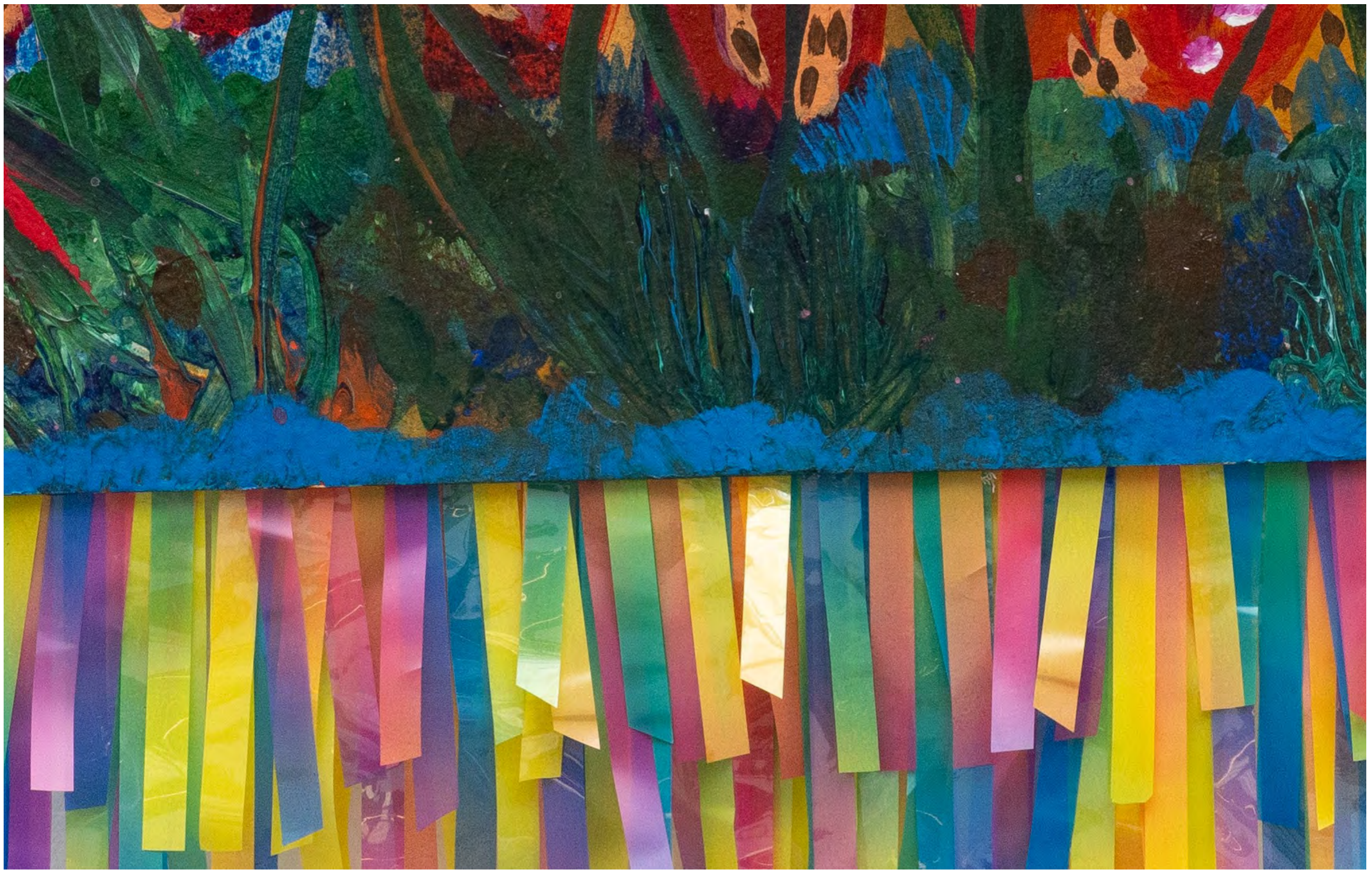
SARA RAMO Erva estelar, 2024 Detalhe [Detail]