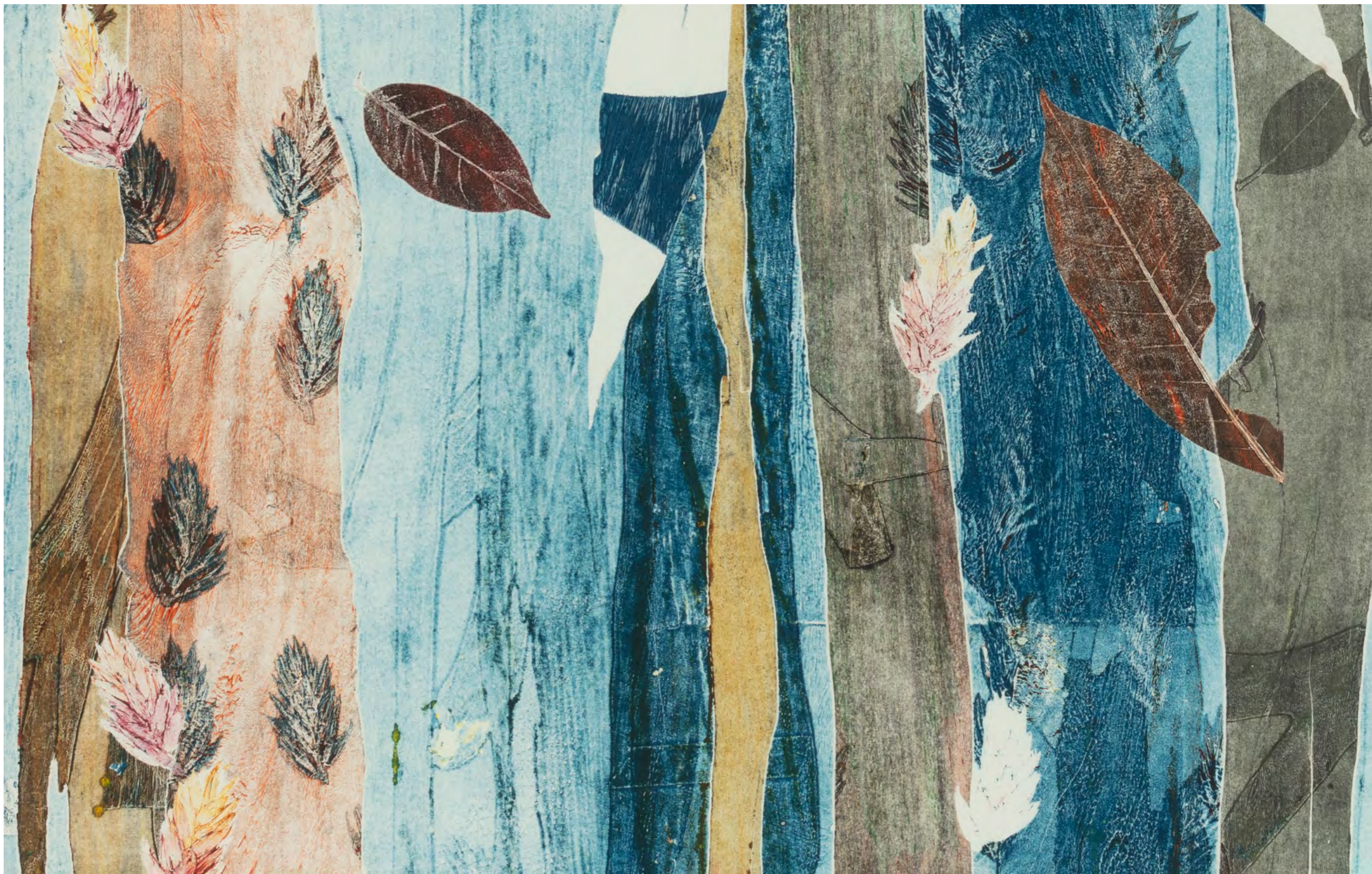
LUIZ ZERBINI Mata azul, 2024 Detalhe [Detail]