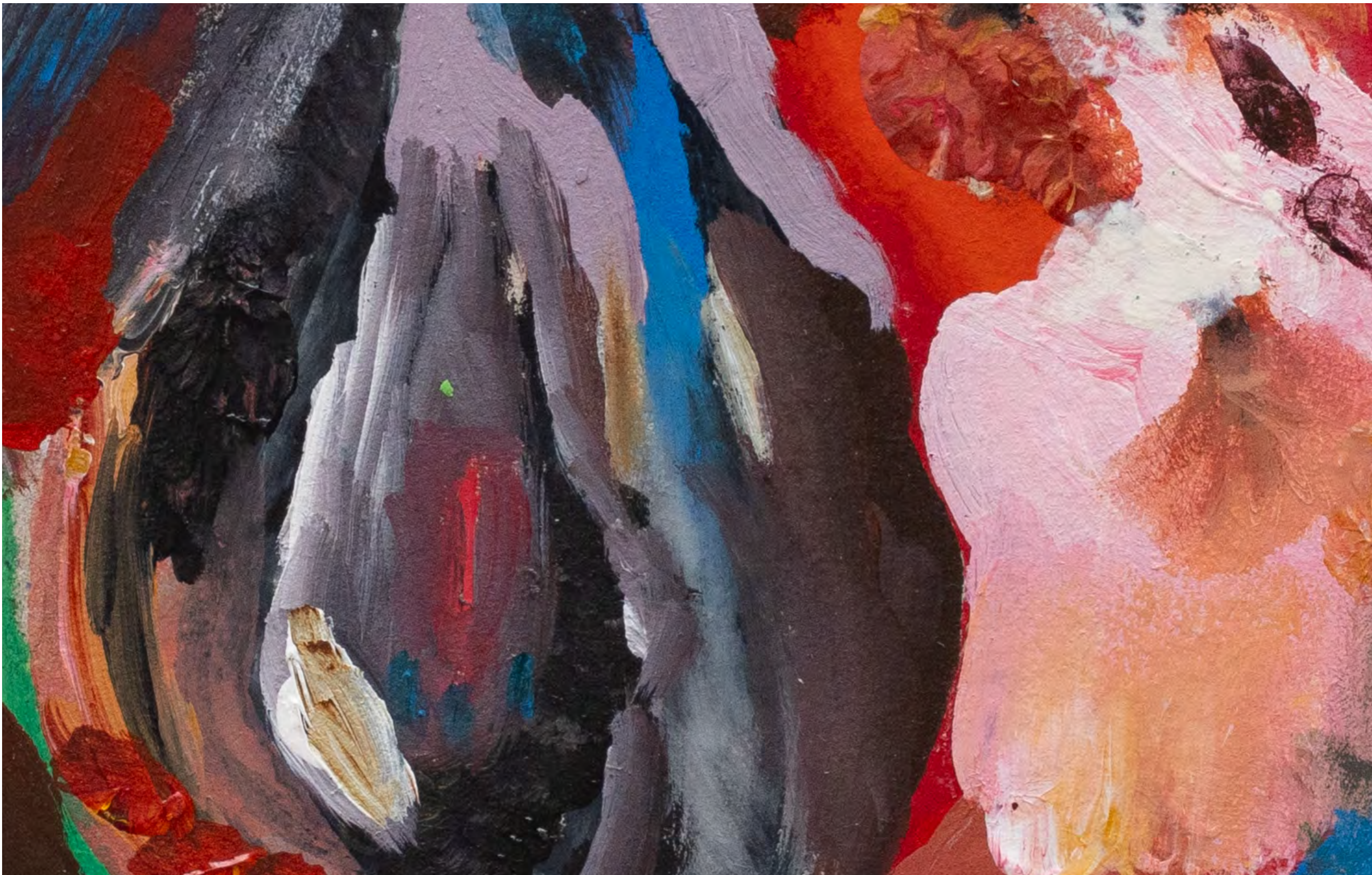
SARA RAMO Matéria singular, 2024 Detalhe [Detail]