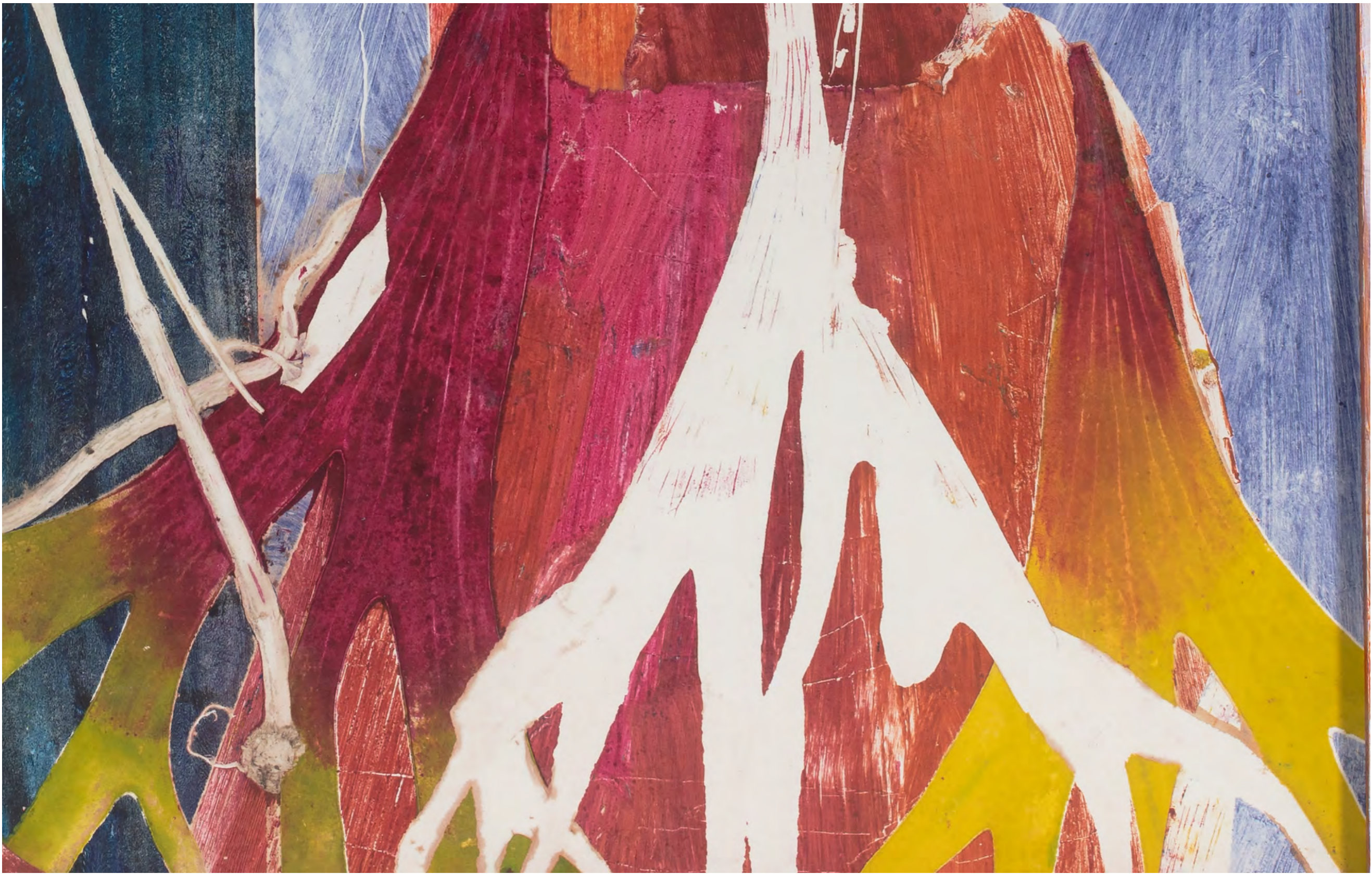
LUIZ ZERBINI Sapopema, 2024 Detalhe [Detail]