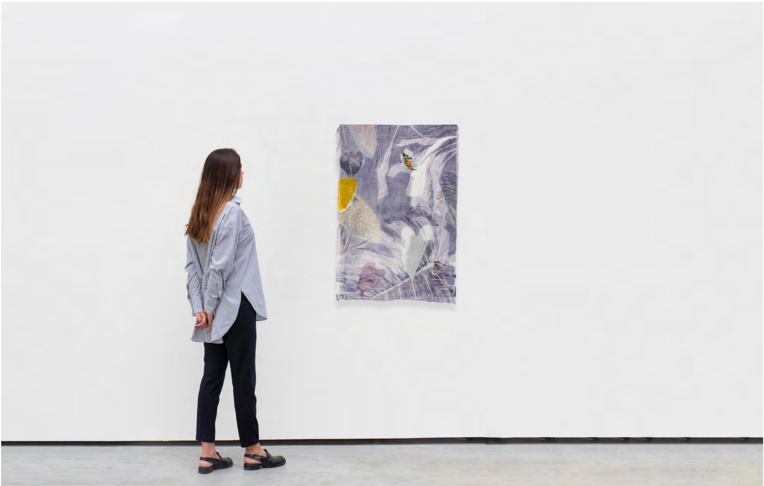
PÉLAGIE GBAGUIDI Incandescence, 2023 Detail [Detalhe]