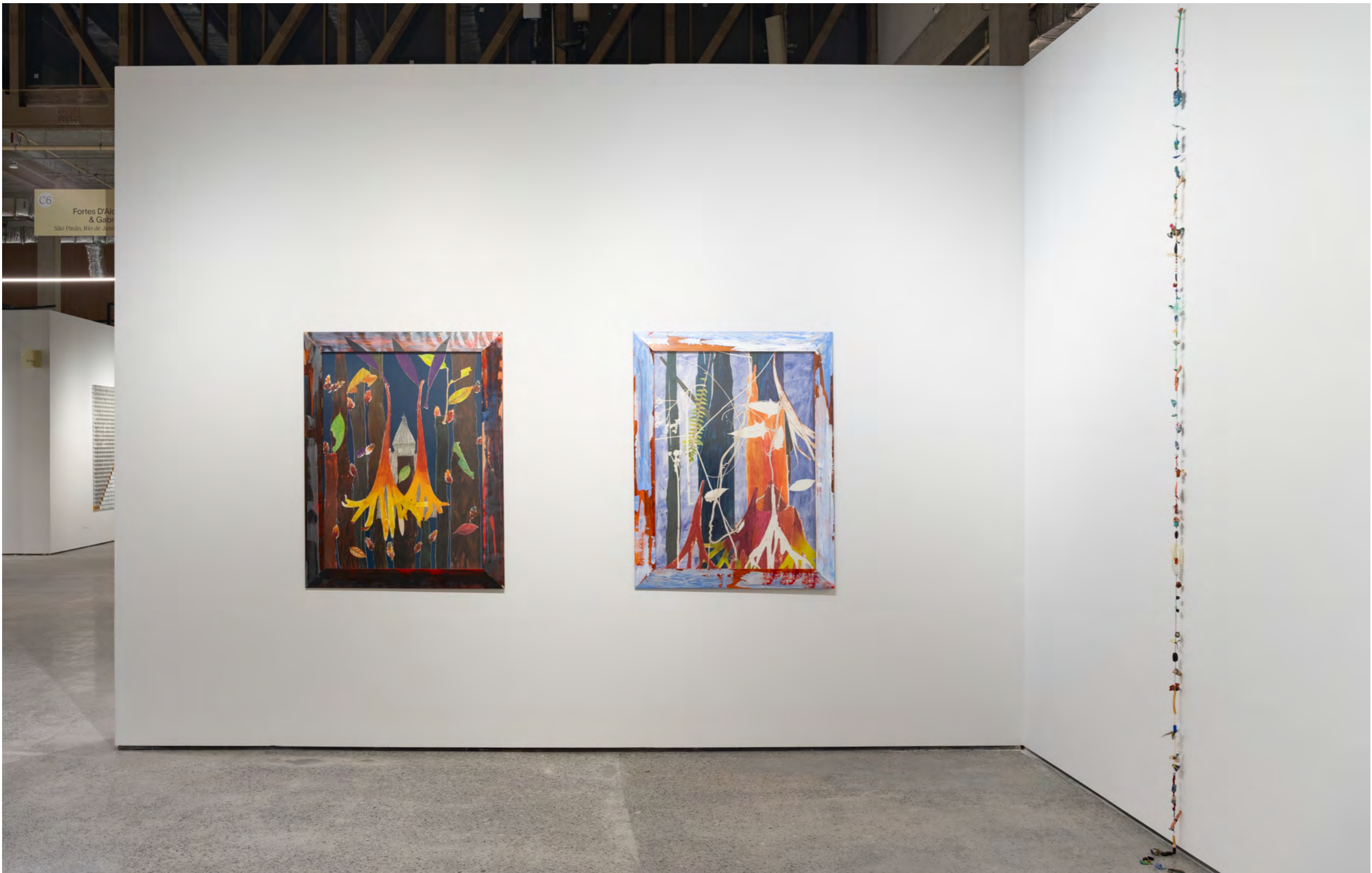
ArPa 2024 Complexo do Pacaembu | São Paulo, Brasil