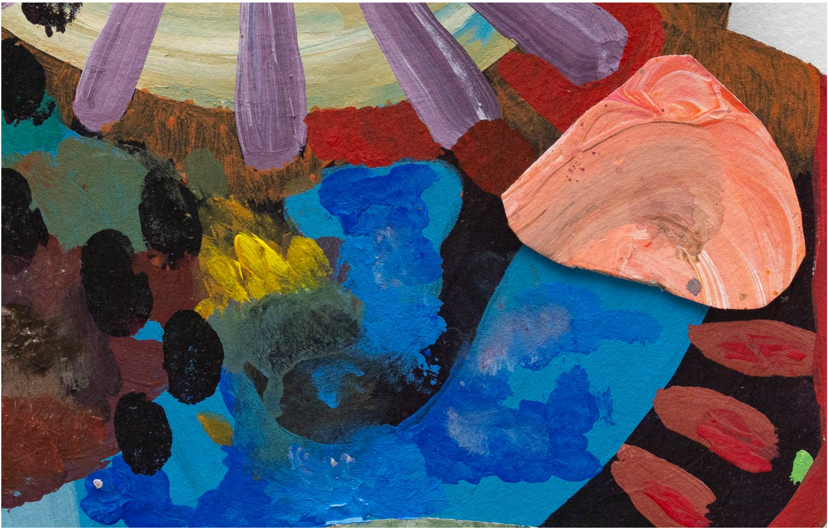
SARA RAMO Volúpia Astral, 2024 Detalhe [Detail]