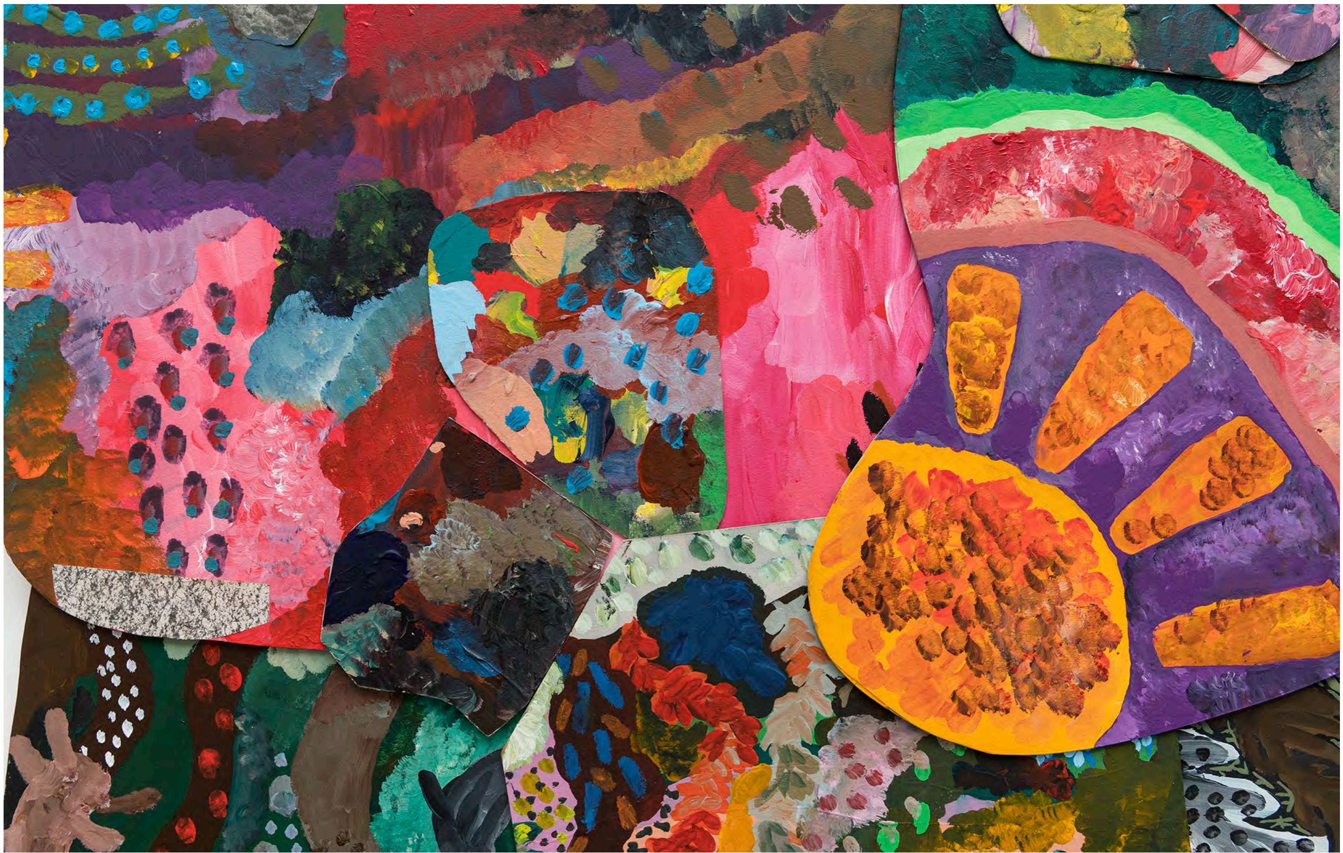
SARA RAMO Destino amoroso, 2024 Detalhe [Detail]