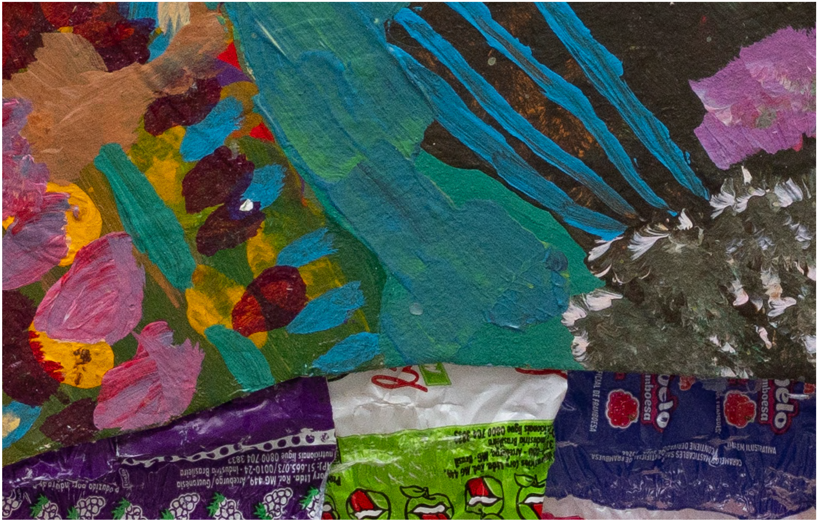
SARA RAMO Ambiente vital, 2024 Detalhe [Detail]