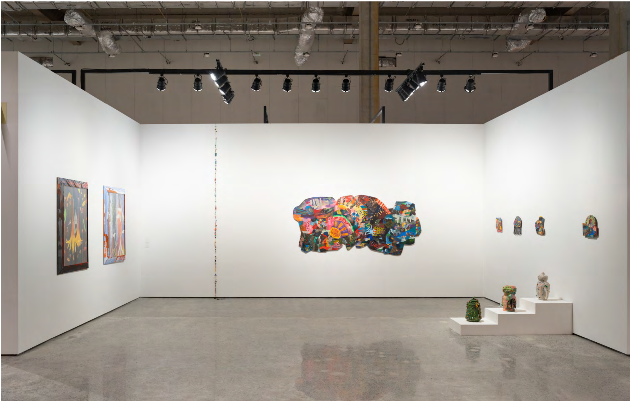
ArPa 2024 Complexo do Pacaembu | São Paulo, Brasil