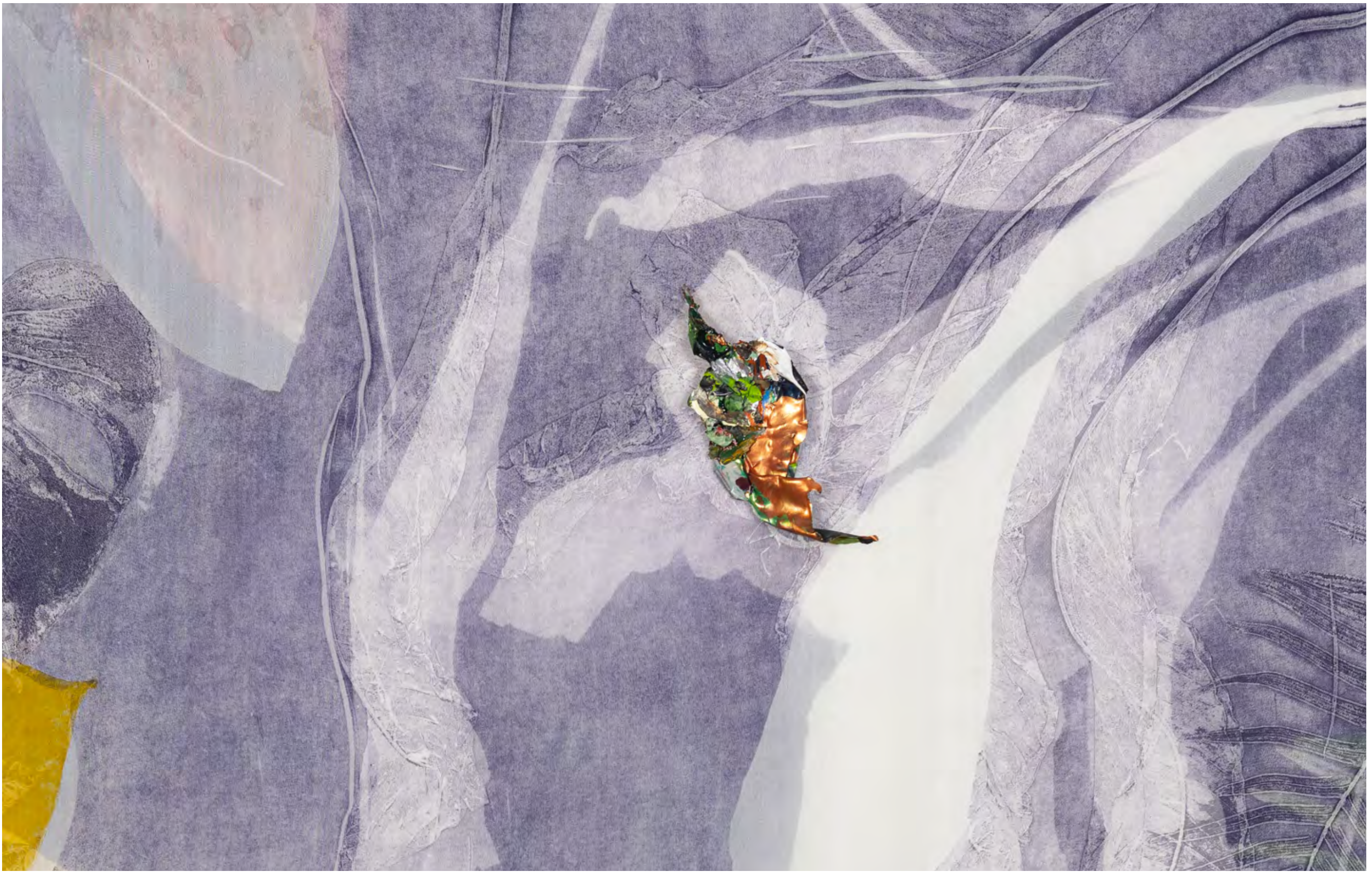
PÉLAGIE GBAGUIDI Incandescence, 2023 Detail [Detalhe]