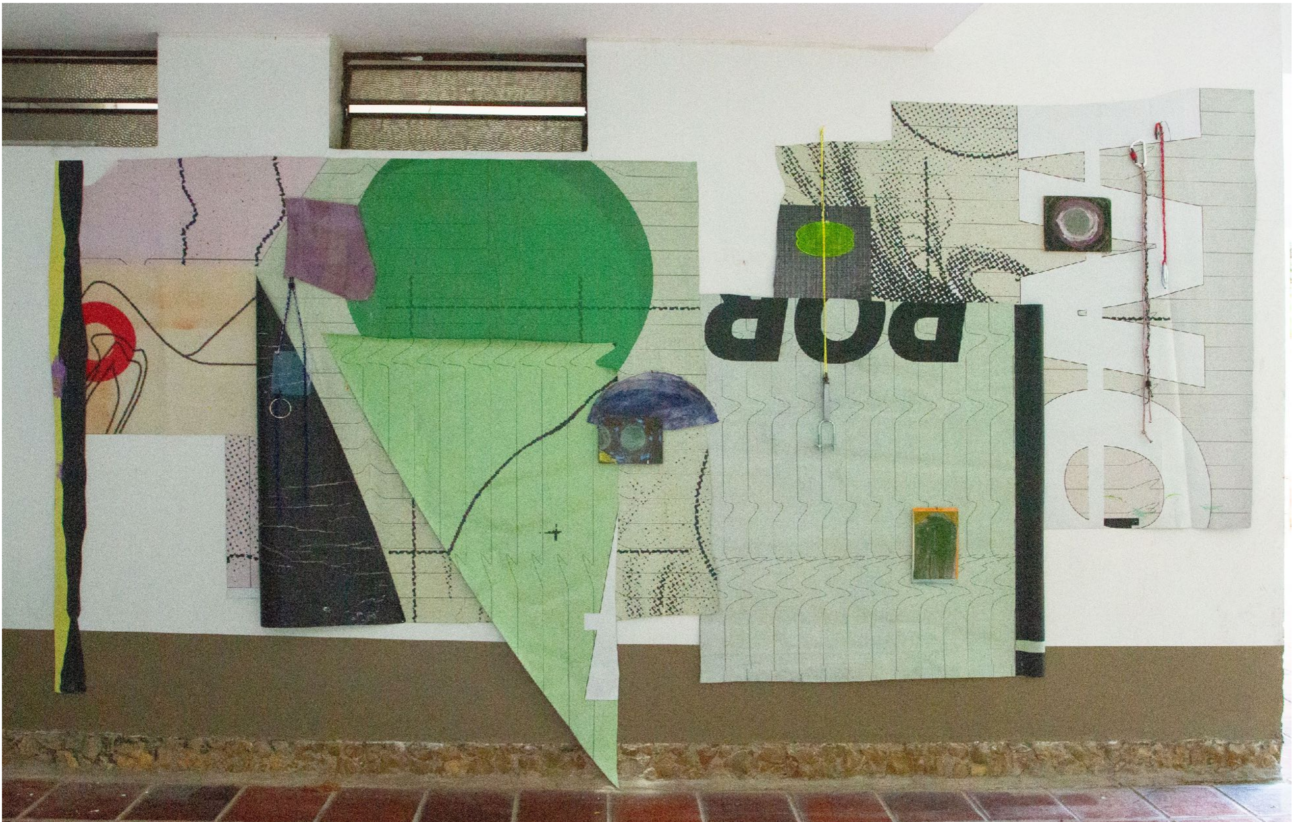
apegos e concessões São Paulo, Brasil, 2024