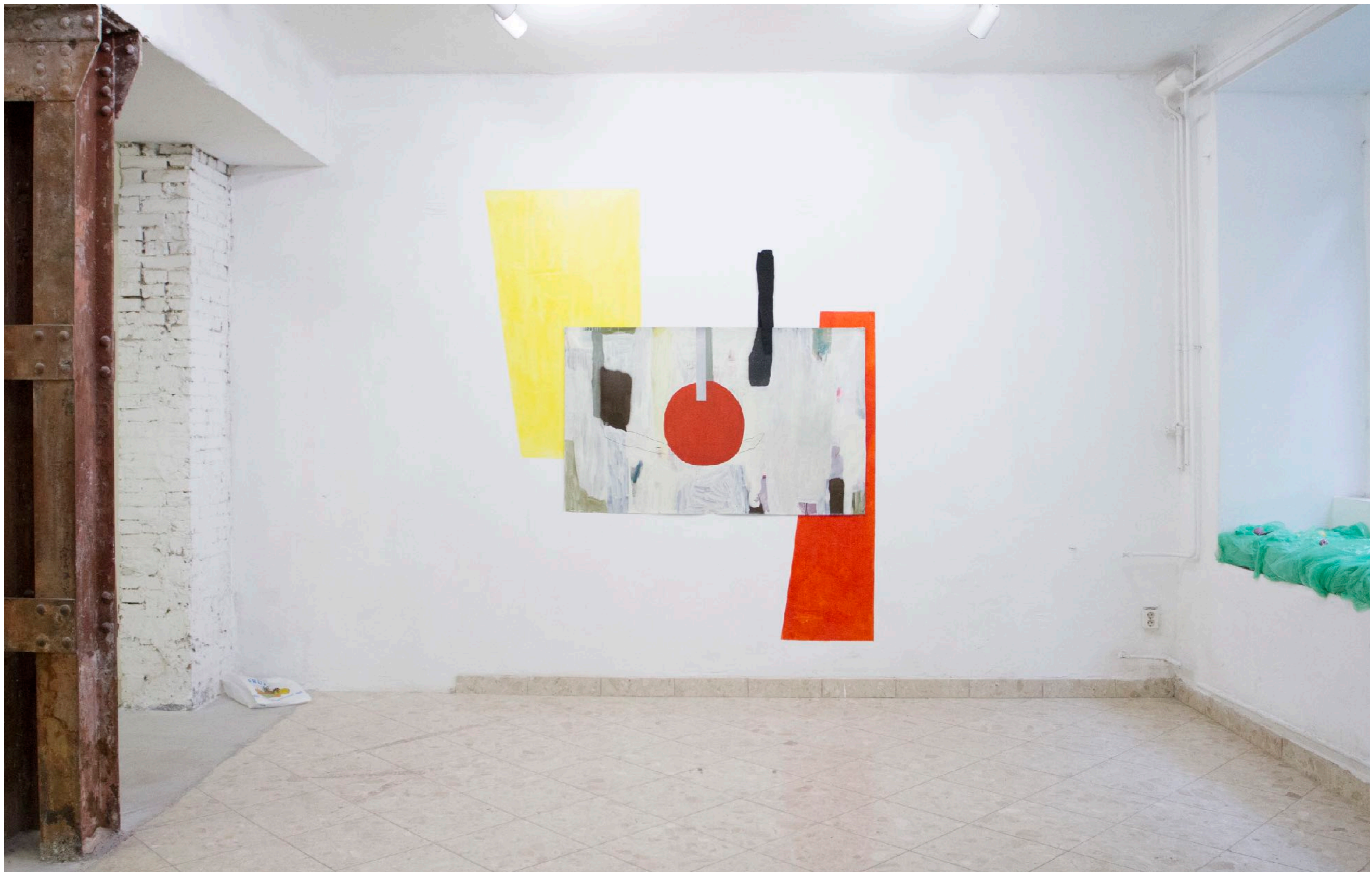
Tatiana Chalhou: On the grass 1111 Project Space | Budapest, Hungary, 2019