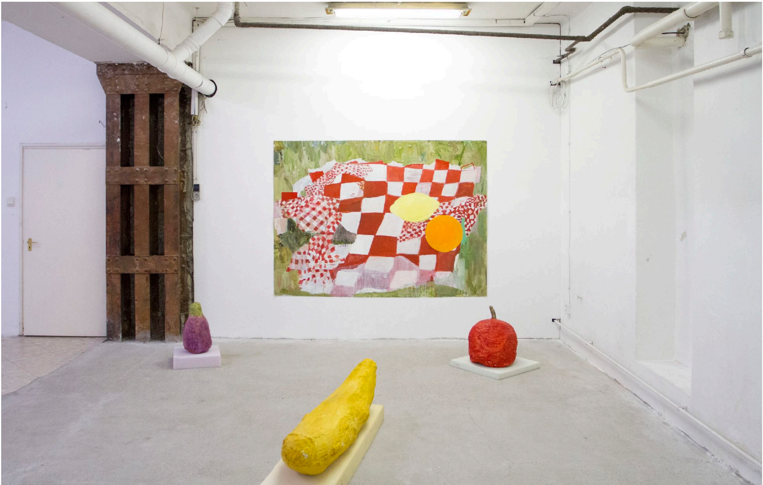
Tatiana Chalhoub: On the grass 1111 Project Space | Budapest, Hungary, 2019