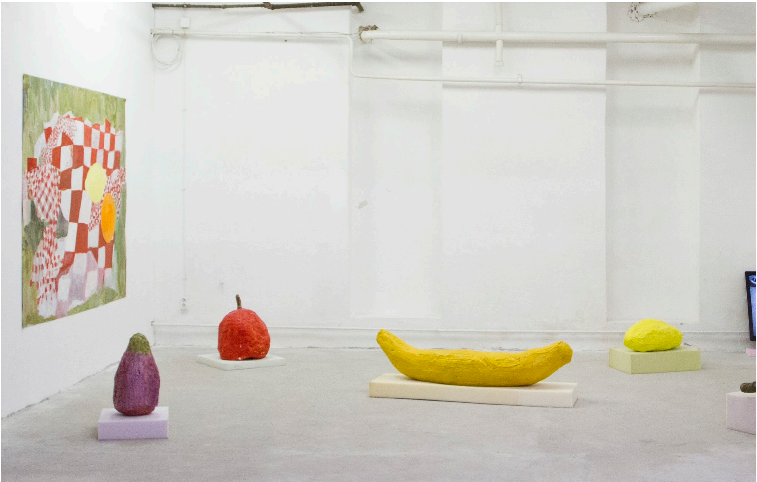
Tatiana Chalhou: On the grass 1111 Project Space | Budapest, Hungary, 2019