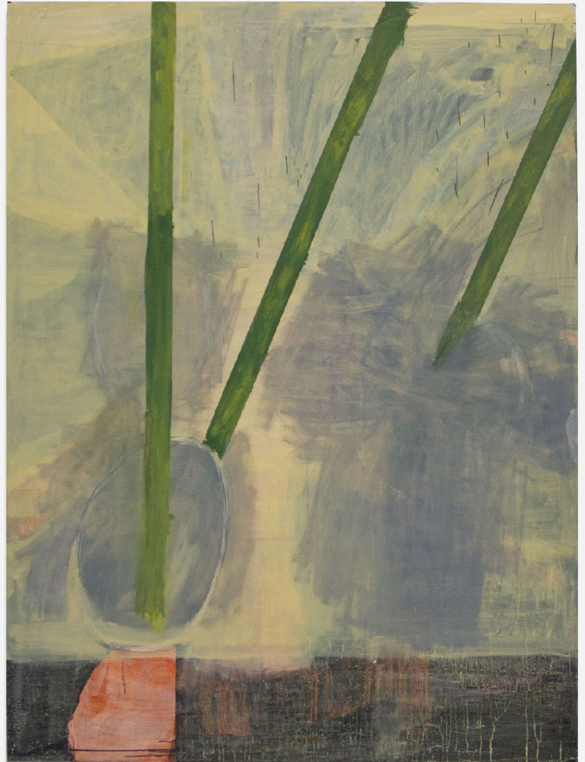
TATIANA CHALHOUB Hastes, 2023 Acrílico e óleo sobre tela [Acrylic and oil on canvas] 200 x 150 cm [78.74 x 59.05 in]