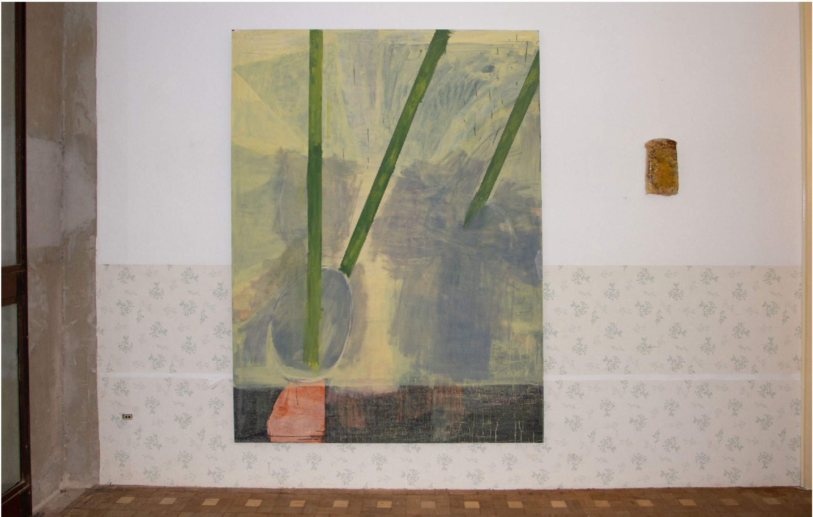
apegos e concessões São Paulo, Brasil, 2024